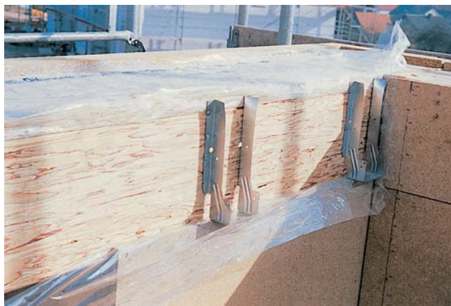
Eine weitere, passivhaustaugliche Deckenkonstruktion im Holzbau: Stegträger werden in Metallvorrichtungen eingehängt, die zuvor im Randbalken angebracht wurden

schlechtert dabei zudem die Energiebilanz, sondern es ergibt sich bei der Berechnung der Aussteifung des Gebäudes über die Wandtafeln ein zu hoher Ansatz der Vertikallasten bei der Aussteifung, so dass möglicherweise die Wandbefestigungen für abhebende Kräfte zu gering bemessen werden. Gerade bei im Holzbau unerfahrenen Statikern habe ich diesbezüglich häufig Nachbesserungen verlangen müssen.